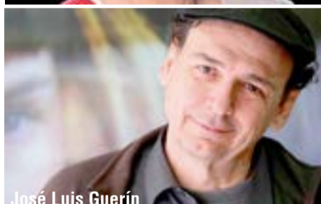
José Luis Guerin