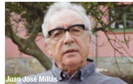
Juan José Millás